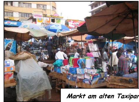
Markt am alten Taxipark

An vielen Plätzen sind Märkte zu finden, wo sich sehr viele Menschen herumtummeln und man schnell den Überblick verlieren kann. Dort gibt es Händler die ihre Ware einfach auf der Straße oder in kleinen Läden oder Ständen feilbieten. Wenn man als Weißer dort auftaucht stürzen die Afrikaner auf einen los und versuchen alles was sie haben zu verkaufen ob du es brauchst oder nicht. Über den Preis muss man vorher hartnäckig feilschen und meistens zahlt man als Muzungu (Weißer, Farbloser) mehr als die Einheimischen.